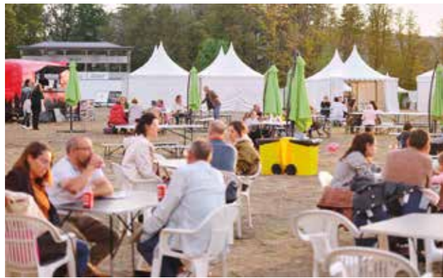
Algunas de las food Truck con la terraza instalada para comer en Naturcyl 2024.

Este año, el lugar elegido para la instalación de las infraestructuras de la feria ha sido el Campo de Polo, en el municipio del Real Sitio de San Ildefonso (Segovia), muy próximo al casco urbano, rodeado de los bosques y cumbres del Parque Nacional de la Sierra de Guadarrama, a escasos diez kilómetros de la ciudad de Segovia, Patrimonio de la Humanidad. La infraestructura de la feria constó de 12 grandes carpas (4.500 m 2 ) y 11 jaimas para albergar a los diferentes expositores y actividades. Además, se instalaron dos zonas para talleres, varias terrazas para comer y diversos food trucks, que ofrecieron un excelente servicio gastronómico al público asistente. En el exterior, se instalaron empresas como Turicleta, el gran planetario móvil de la empresa Planetario Go, una instalación para dos ejemplares de burro zamorano traídos por la Diputación de Zamora, y un set de prensa con emisoras como Radio Viajera. El recinto también contaba con baños.