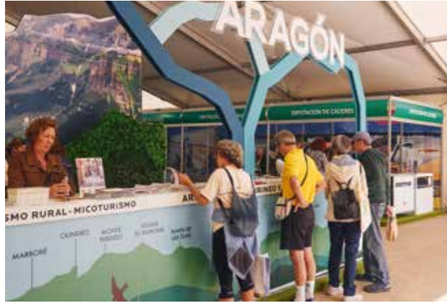
Aragón destino Naturcyl 2024.