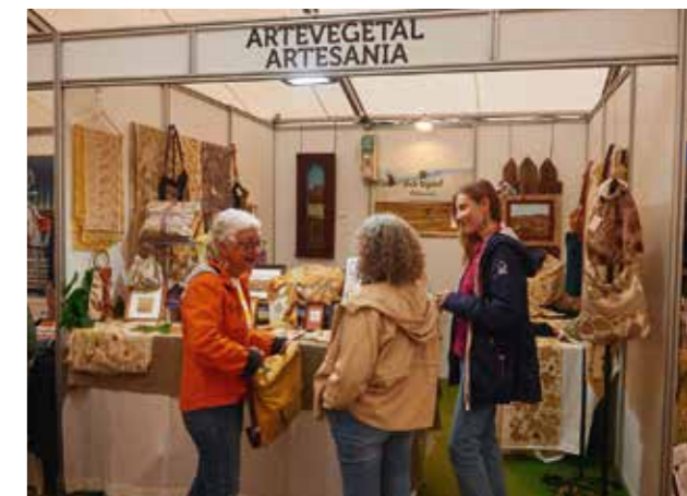
Los artesanos tuvieron gran presencia en Naturcyl 2024.