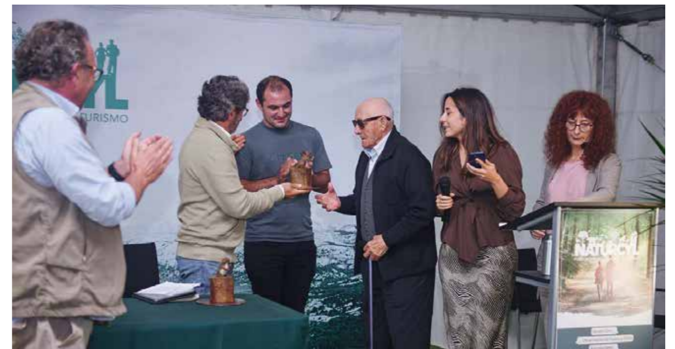
Entrega del Premio a la Conservación Jesús Garzón al alcalde de El Oso que inicio la conservación de la laguna.

El galardón de 2024 fue concedido al Ayuntamiento de El Oso, en Ávila, por su proyecto para mejorar el ciclo del agua de la Laguna del Oso y favorecer la reproducción de aves acuáticas, contando con el respaldo de la Global Birdfair.