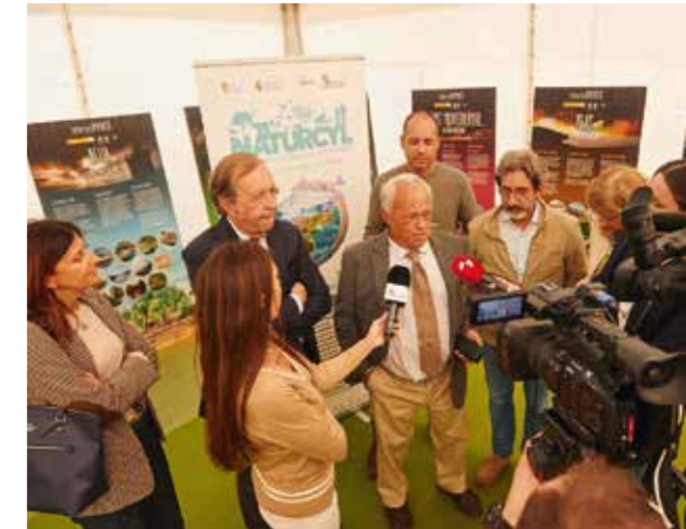
Autoridades y director de Naturcyl durante la inauguración de la Feria.