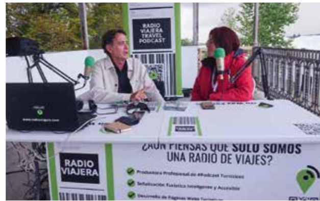
Set de prensa instalado en Naturcyl 2024.