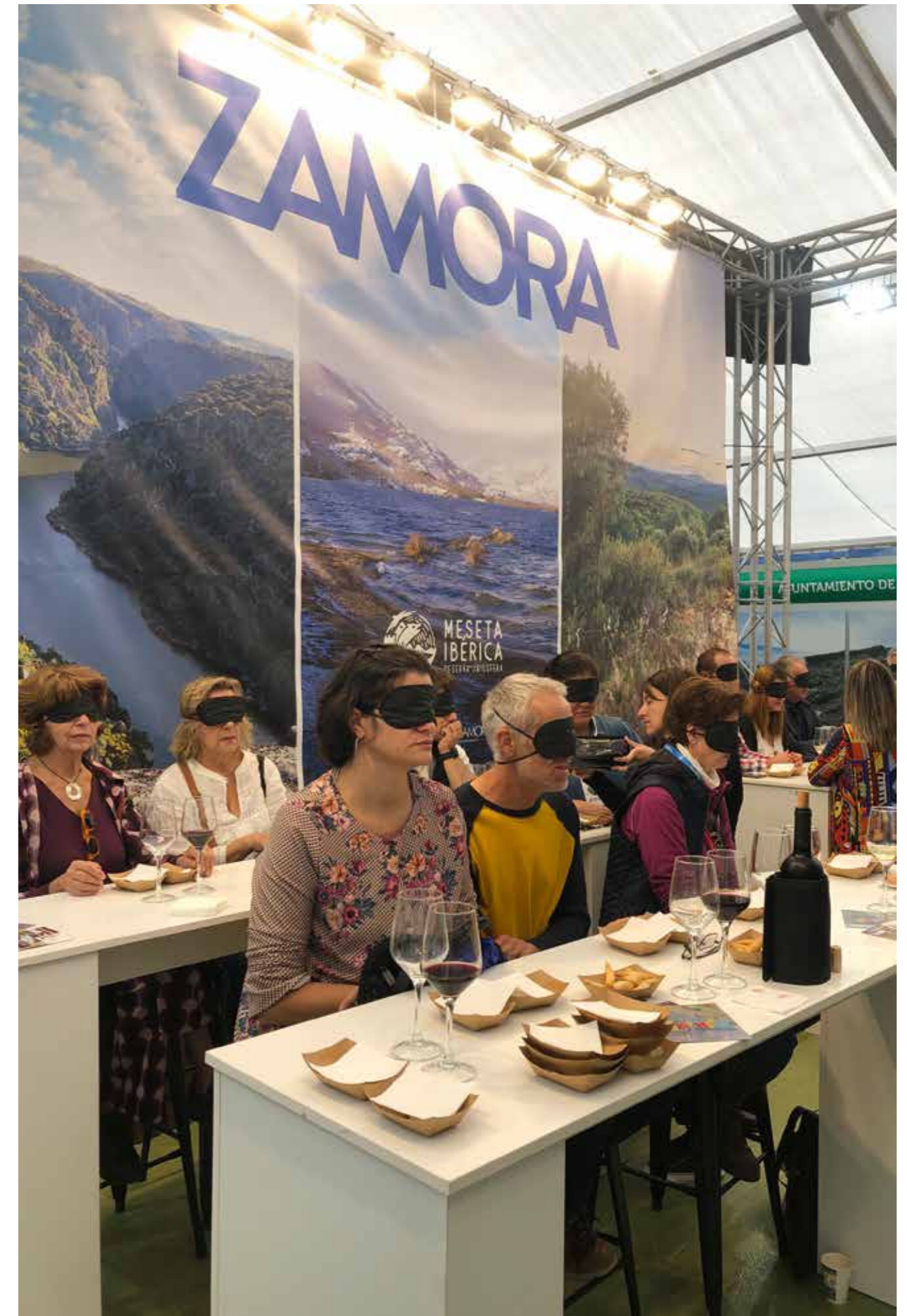
Cata a ciegas de productos de la provincia de Zamora.