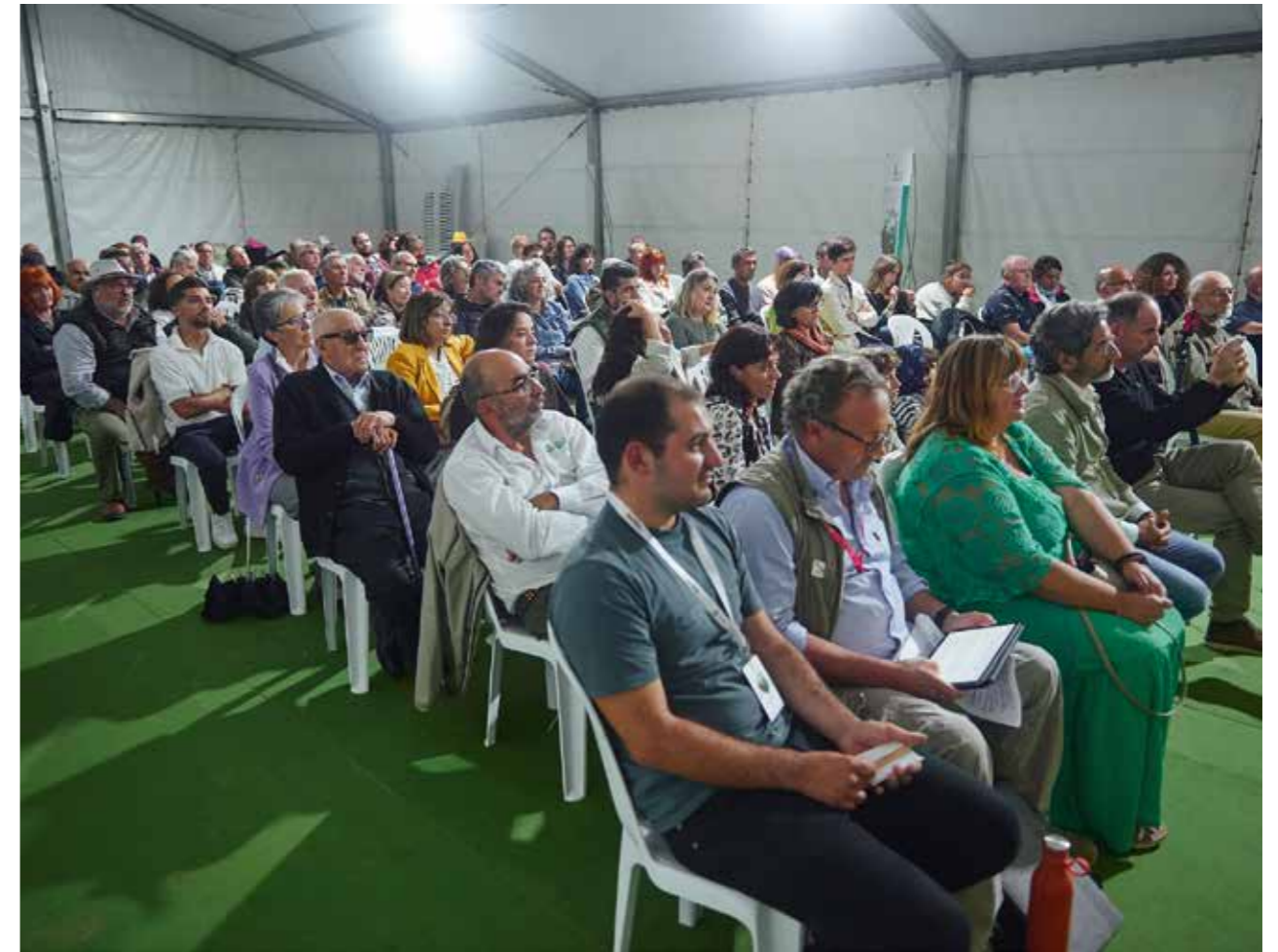
Las diferentes actividades fueron seguidas por cientos de personas en Naturcyl 2024.