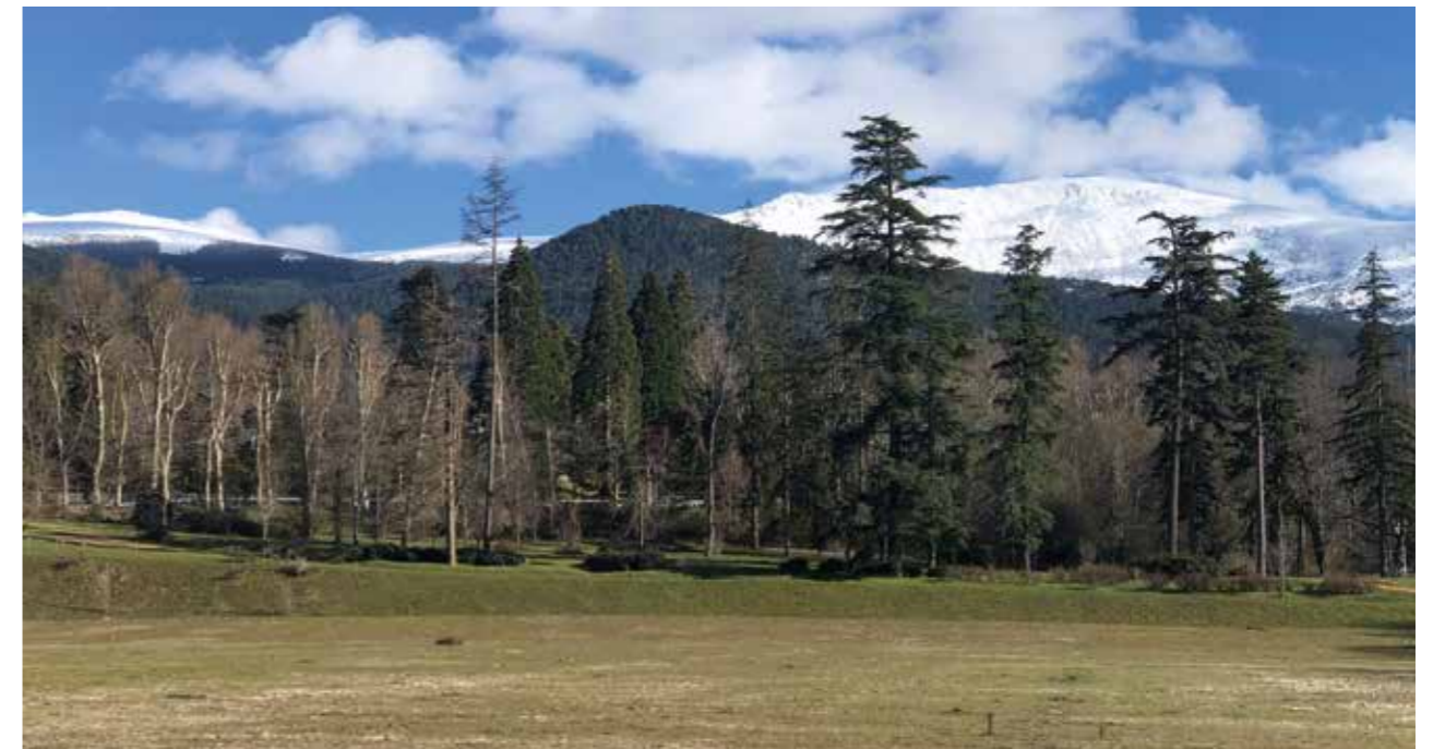
Parque Nacional de Guadarrama y pico de Peñalara al fondo, escenario de Naturcyl 2024.