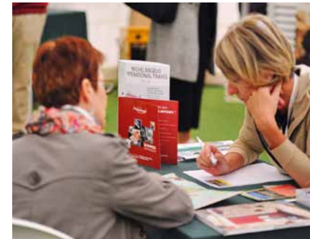
Momento de trabajo durante el mercado de contratación con tour operadores británicos.