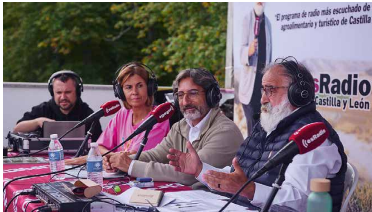
Emisión en directo del Programa de radio El Picaporte desde Naturcyl 2024.