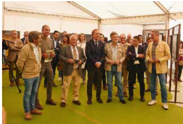
Personalidades durante la inauguración de Naturcyl 2024.