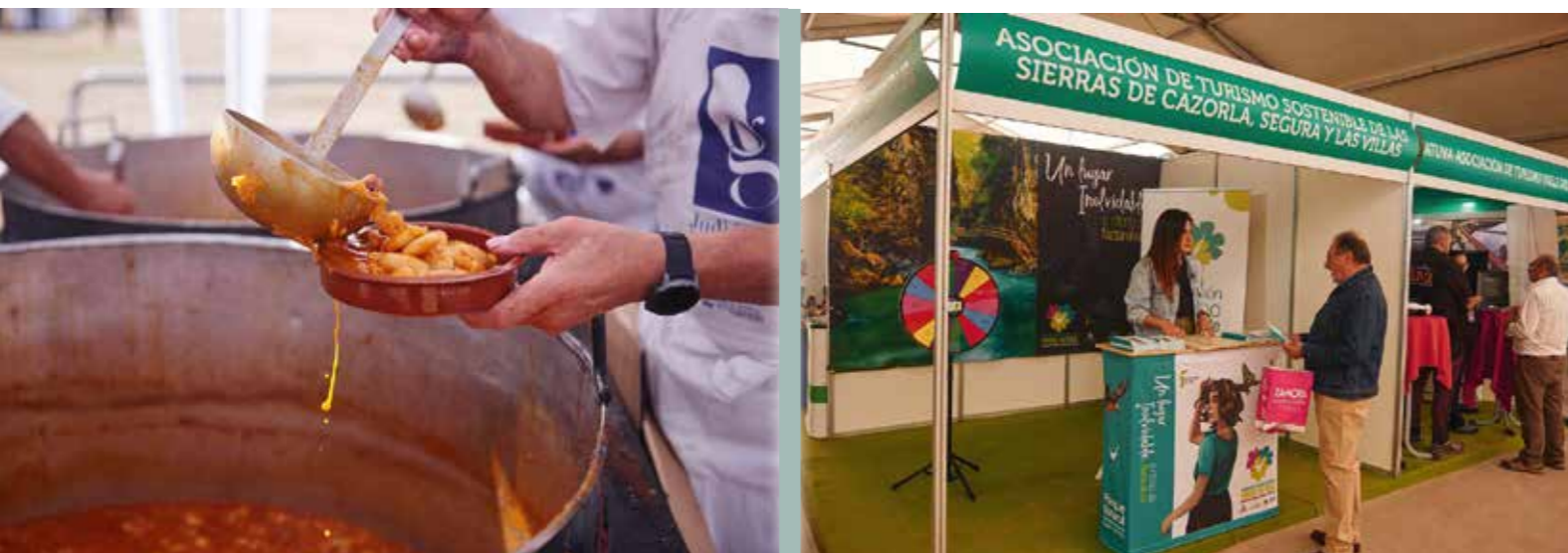
Servicio de la judiada que se organizó el sábado para recaudar fondos para la laguna de El Oso. Algunos stand que participaron en Naturyl 2024.

En el exterior se organizó una exposición de ejemplares de asno zamorano-leonés con la colaboración de la Asociación Nacional de Criadores y el Ayuntamiento de Zamora.