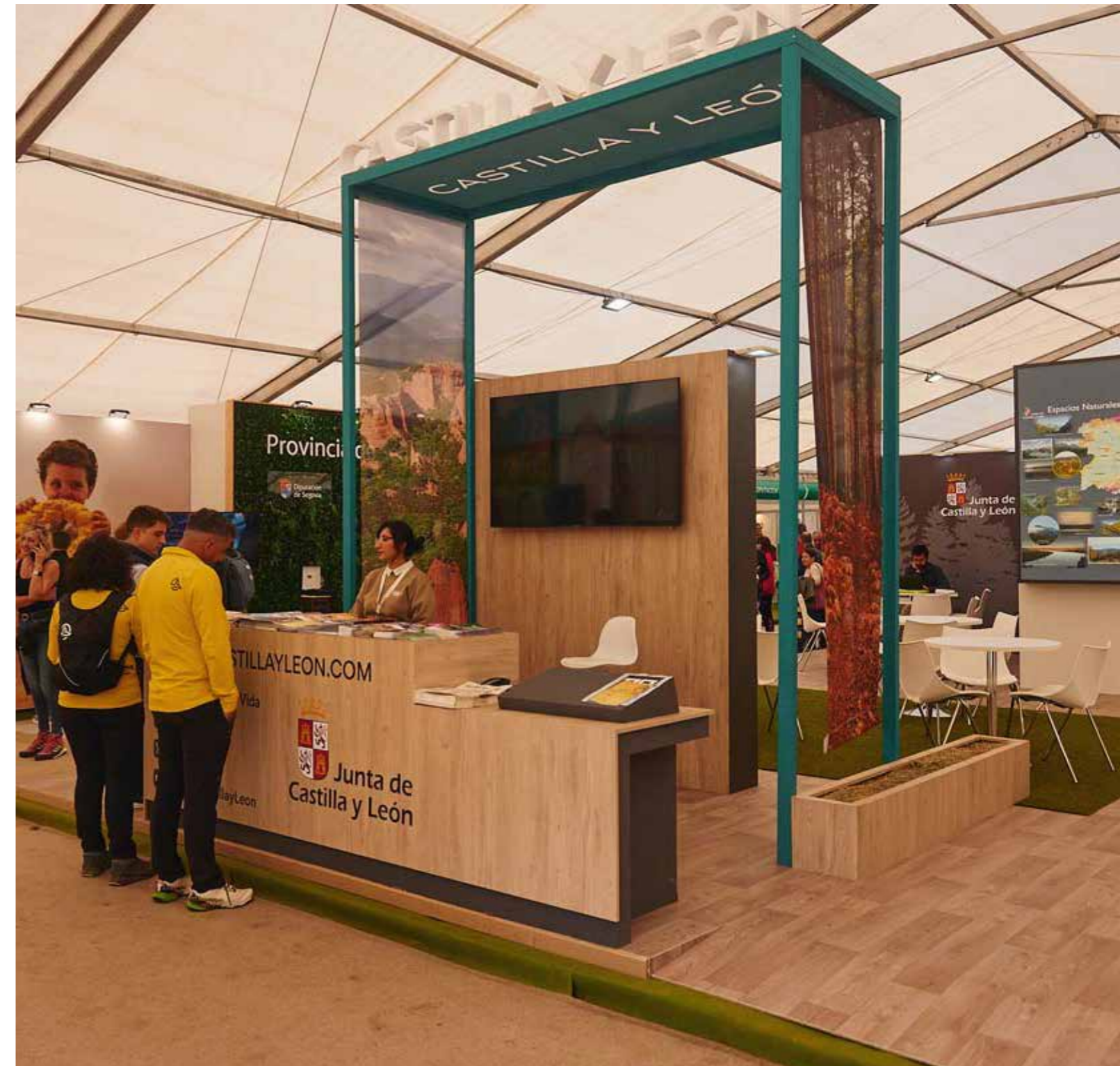
Stand de la Junta de Castilla y León.