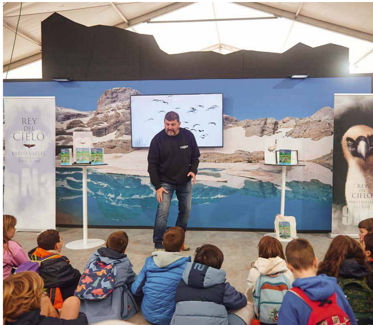
El stand de Aragón fue uno de los más activos organizando actividades, talleres y catas de sus productos estrella.

Desde su primera edición, Naturcyl ha generado grandes expectativas, que año tras año se han visto cumplidas, con ocupaciones hoteleras casi al 100% en un radio de 15 kilómetros del Real Sitio de San Ildefonso. Estos datos proporcionan a la organización la confianza para continuar trabajando en la misma dirección, creando nuevas oportunidades de desarrollo para la región.