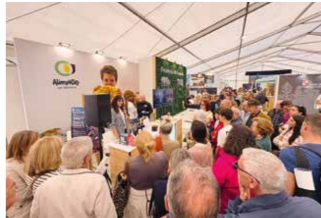
Las actividades de ecoturismo gastronómico tuvieron un papel importante en esta edición de Naturcyl.