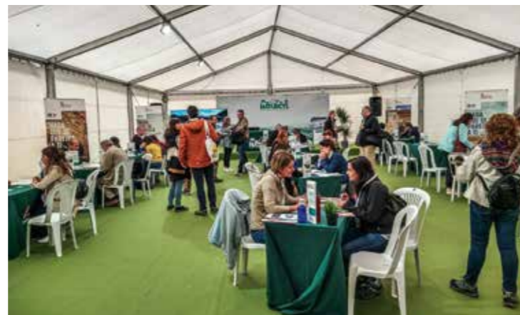
Mercado de contratación para profesionales de turismo de naturaleza.