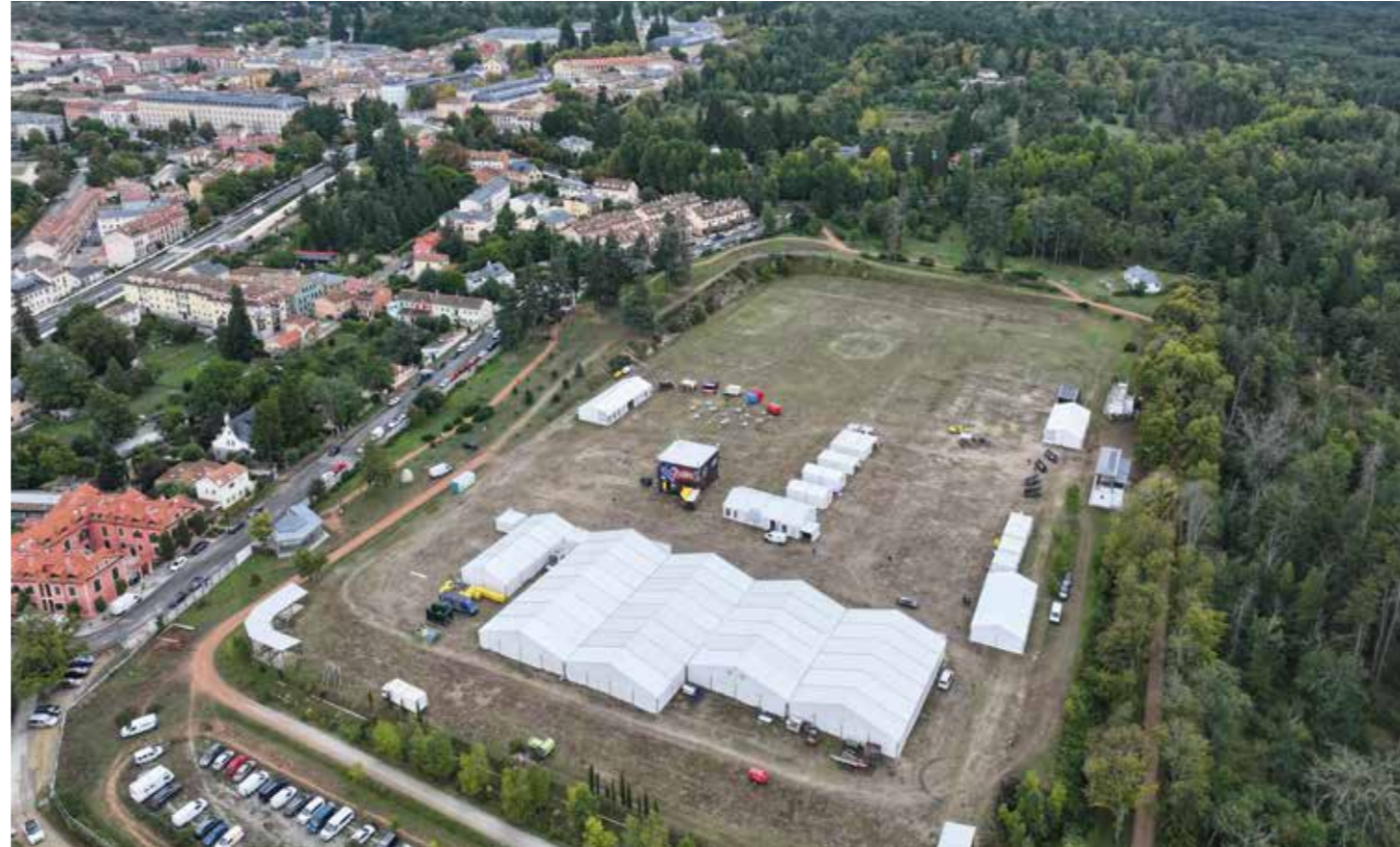
Vista de las instalaciones de Naturcyl 2024.

La feria fue un espacio ideal para el intercambio comercial y de negocios entre los actores del turismo de naturaleza y el desarrollo rural. La jornada de comercialización celebrada el viernes 20 de septiembre con 15 touroperadores, tanto europeos como nacionales, brindó una gran oportunidad para establecer contactos comerciales y expandir los negocios de las 75 empresas y destinos participantes.