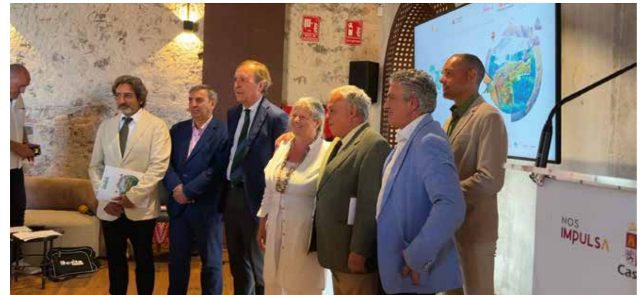
Presentación de la VII Feria de Ecoturismo Naturcyl 2024 en julio en el Real sitio de San Ildefonso (Segovia).