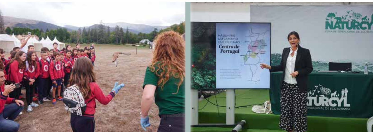
Escolares liberando un cernícalo recuperado por F. Patrimonio Natural de la Castilla y León.