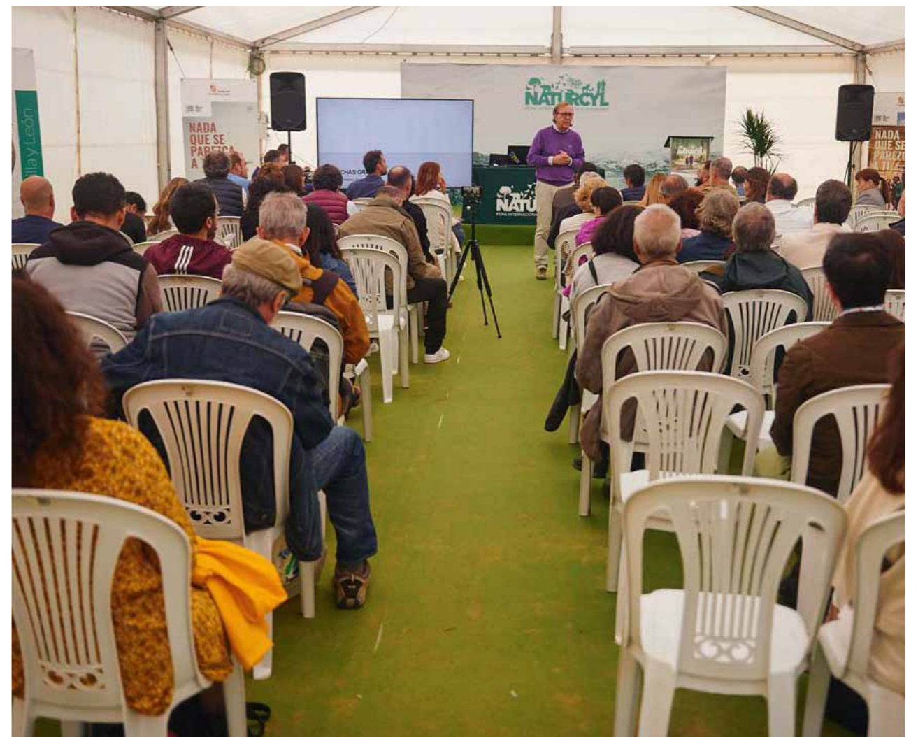
Sala principal de conferencias.