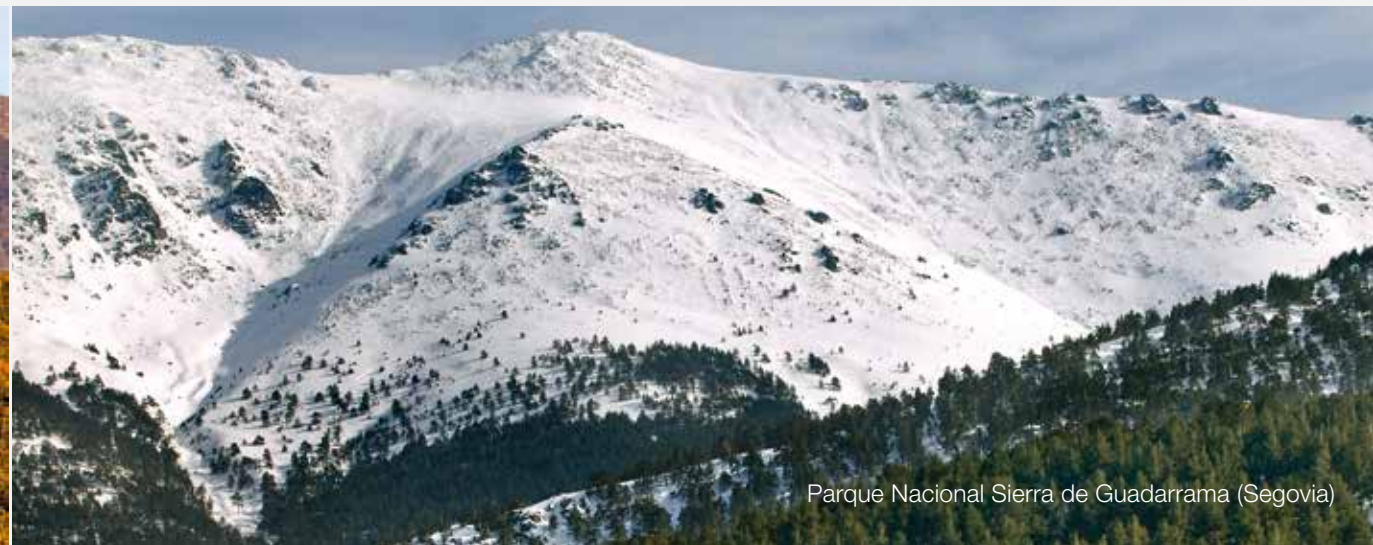
Parque Nacional Sierra de Guadarrama (Segovia)