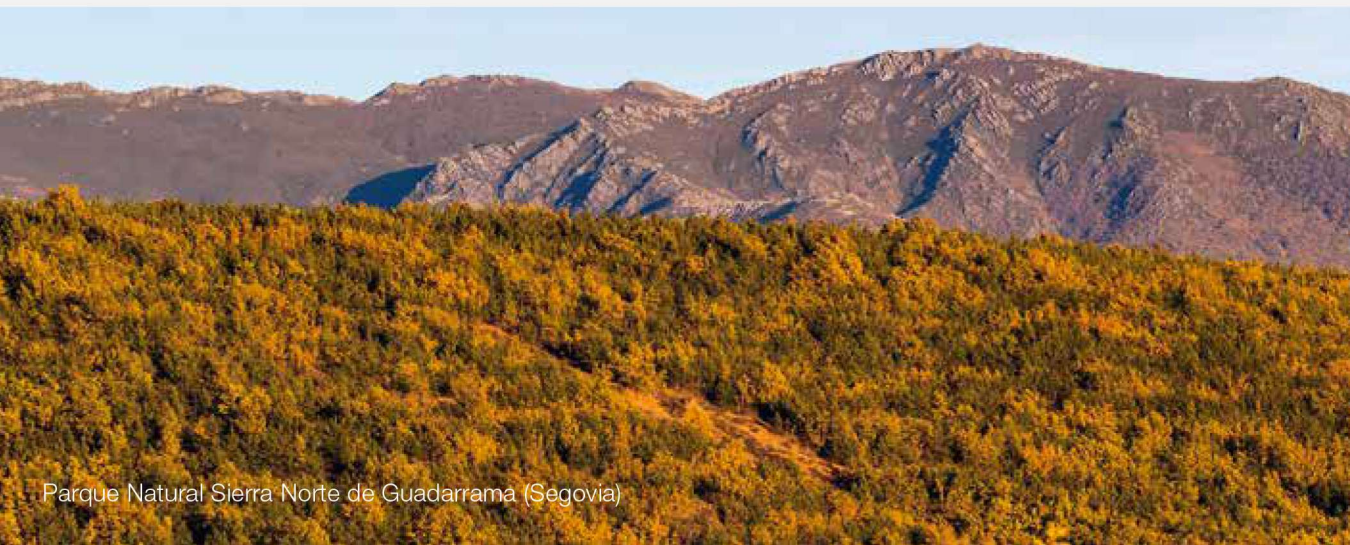
Parque Natural Sierra Norte de Guadarrama (Segovia)