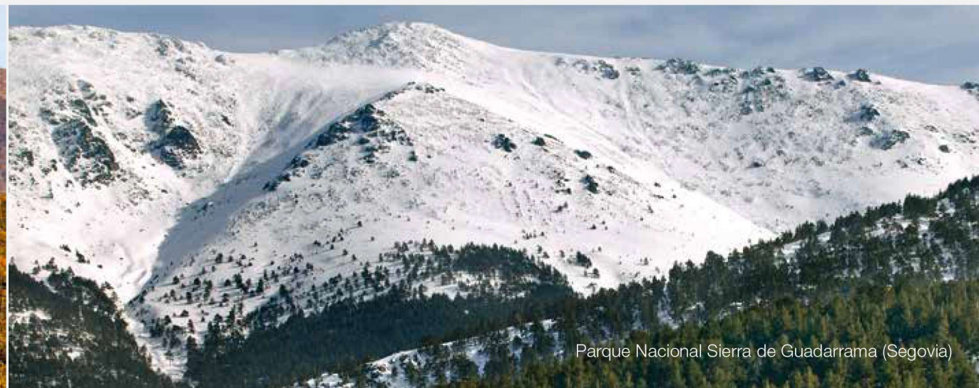
Parque Nacional Sierra de Guadarrama (Segovia)